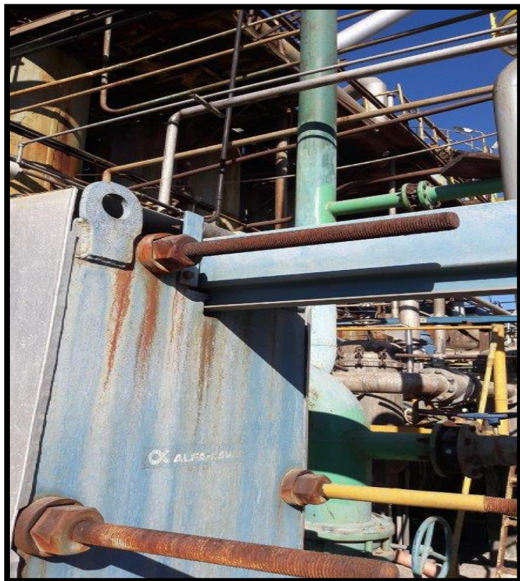
Fotografía N° 3: vista de los espárragos y bulones del intercambiador de placas.

En el armado debe verificarse la distancia inicial de 353 mm según especificación técnica original del paquete de placas y verificar que la línea oblicua o marca coincida con la inicialmente.