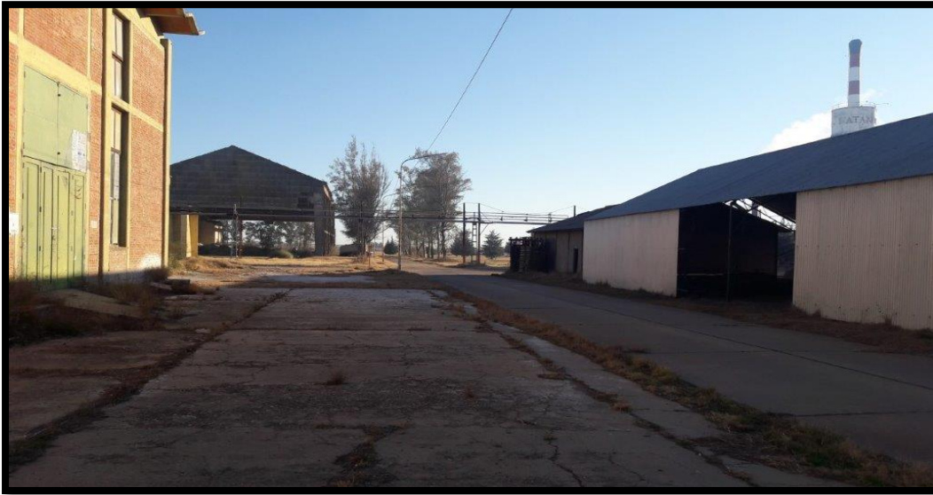
Fotografía N°1: Vista general de zona de instalación de equipos para realizar el mantenimiento.

Si las instalaciones asignadas no son suficientes por algún motivo, el proveedor con previo aviso y coordinación en común acuerdo con FMRT, puede instalarse cercano a la ubicación del intercambiador de placas.