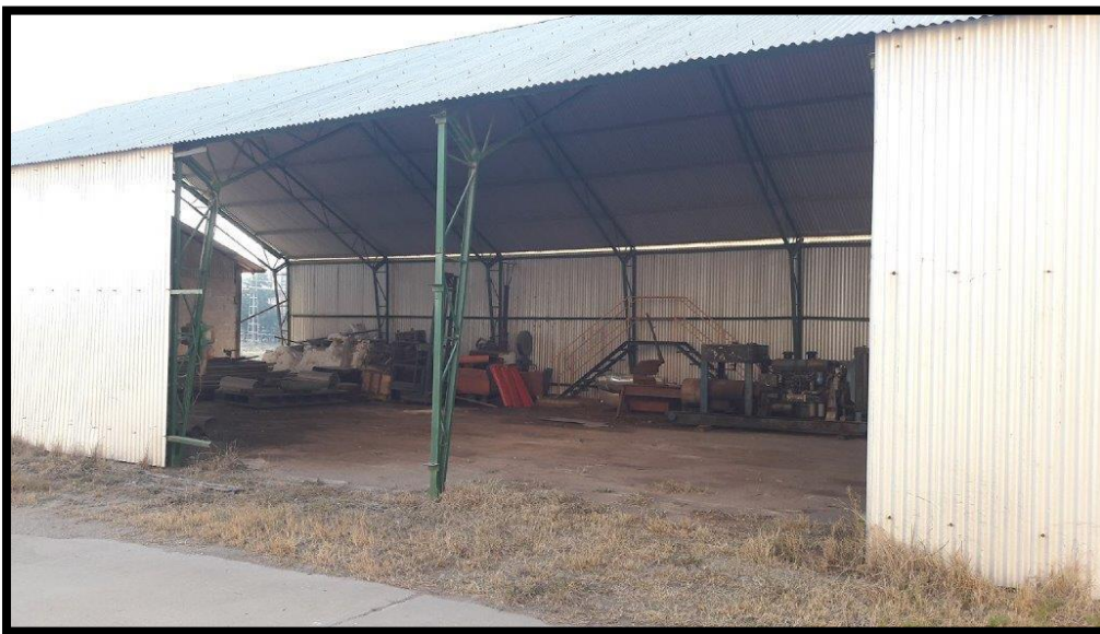
Fotografía N°2: Tinglado disponible para realizar los trabajos.