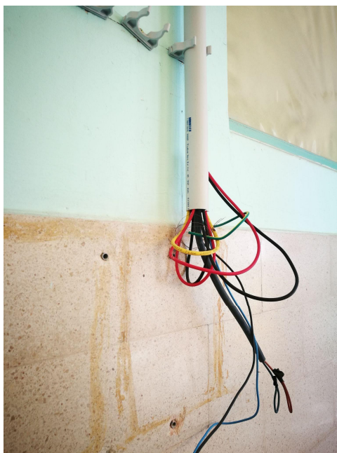
Figura 3: Tablero secundario inexistente