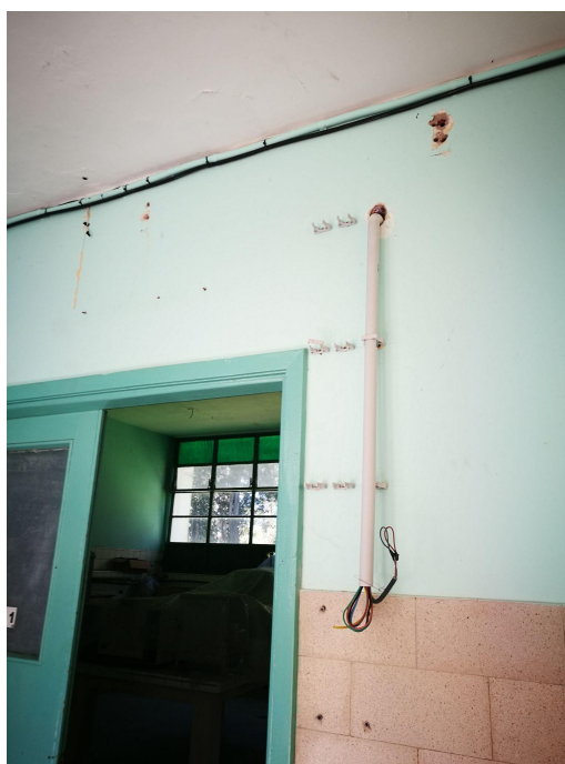
Figura 4: Bandeja superior de alimentación inexistente