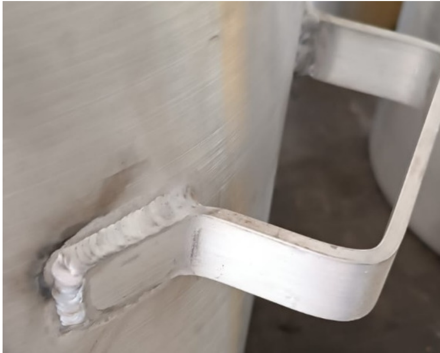
Imagen de referencia – Detalle de Soldadura